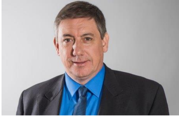
Minister van Binnenlandse Zaken Jan Jambon